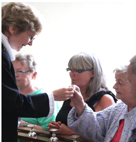
Nadver i Kappel kirke

Langø Kirke har fået repareret vinduerne.