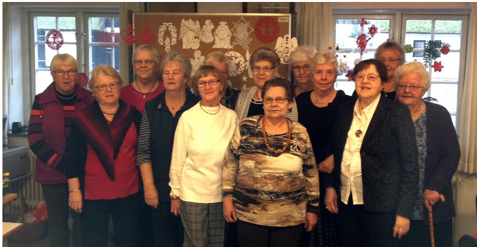
Basarkredsens flittige hold!

at alle der ønsker det, kan modtage et eksemplar. Så mail ( hgj@km.dk ) eller ring (54944180) navn og adresse til præsten, så skal jeg sørge for at det nye kirkeblad kommer.