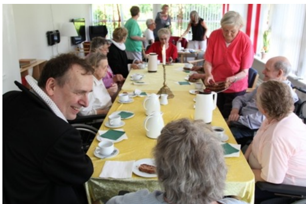
Gudstjeneste i Fredsølmparken