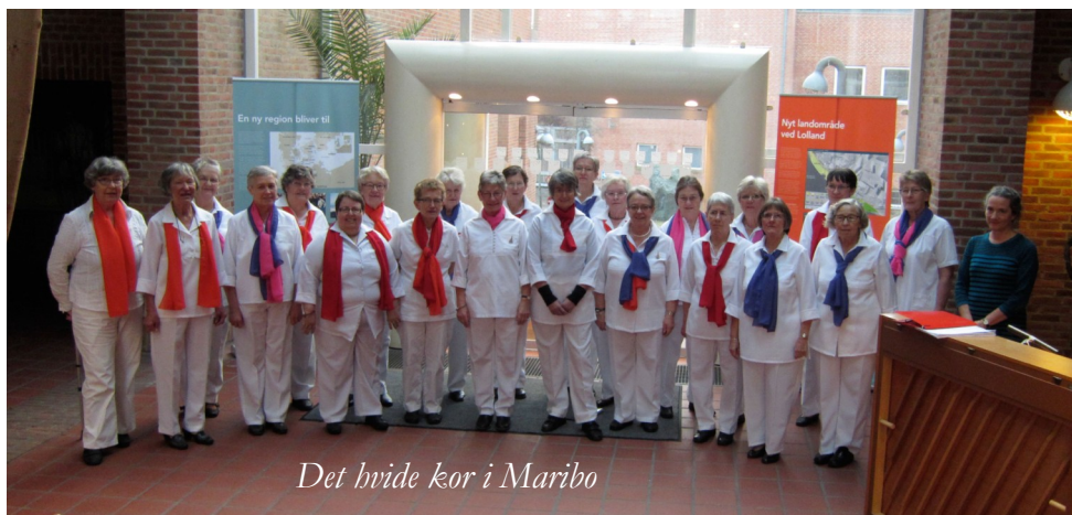
Det hvide kor i Maribo