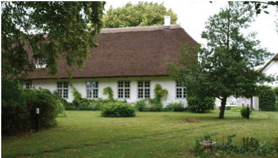
Gloslunde præstegård set fra haven